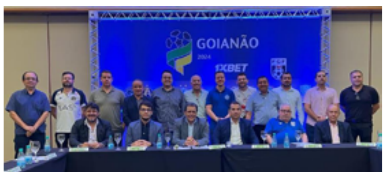
Clubes e Federação se reuniram para definir detalhes do Goianão 2024

Ficou aprovada no Conselho a utilização do VAR (árbitro de vídeo) em qualquer partida do Goianão. Inicialmente, está prevista a utilização do VAR nas fases finais. Porém, a Federação Goiana de Futebol está em fases de experiências com uma nova ferramenta de VAR e, caso a ferramenta apresente resultados satisfatórios nestes testes, a tecnologia poderá ser implementada em mais jogos do campeonato.