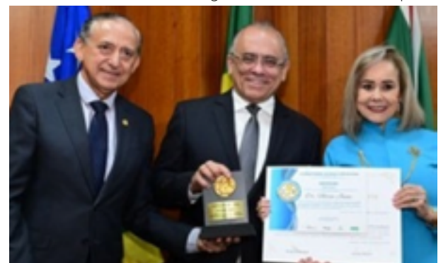
Intelectuais homenageados nos 54 anos da Aflag