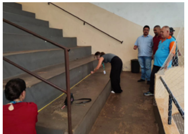
REFORMA E MODERNIZAÇÃO: Engenheiros da Goinfra fazem medição no Ginásio Tancredo Neves, em Caçu — Foto: Reprodução.

Em relação às adequações de acessibilidade, deverão ser implementadas rampas de acesso à quadra, bem como a construção de recuo para possibilitar acesso de pessoas com problemas de mobilidade. Vestiários deverão ser adaptados ao público com necessidades especiais.