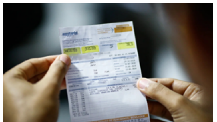
Programa Tarifa Social: Famílias de baixa renda de Mineiros poderão obter isenção no pagamento dos serviços de fornecimento de água e tratamento de esgoto

Para se inscrever, os interessados devem acessar o site oficial da prefeitura municipal e preencher o cadastro. Também é possível se cadastrar pessoalmente na sede da prefeitura.