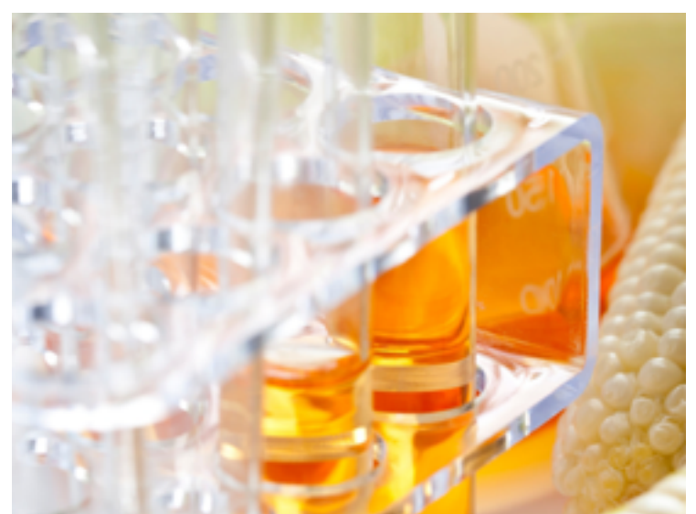
No Brasil, setor sucroalcooleiro pode ajudar na transição energética, mas é utilizado apenas 17% da capacidade de subproduto

A biomassa de cana representou 15,4% da oferta interna de energia no Brasil em 2022. É a maior parcela entre as fontes renováveis de energia que compõem a atual matriz nacional. A informação é do Relatório Síntese do Balanço Energético