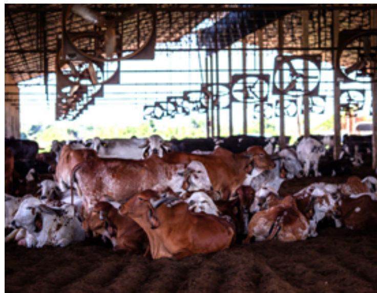
Gado girolando: nova linha de crédito pode financiar até 100% de projetos na cadeia leiteira

Outra ação do Governo de Goiás que fortalece a produção de leite no estado é o trabalho no Centro de Biotecnologia em Reprodução Animal (Biotec) da Universidade Estadual de Goiás (UEG), com previsão de R$ 300 milhões em investimentos para contemplar até 2 mil produto-