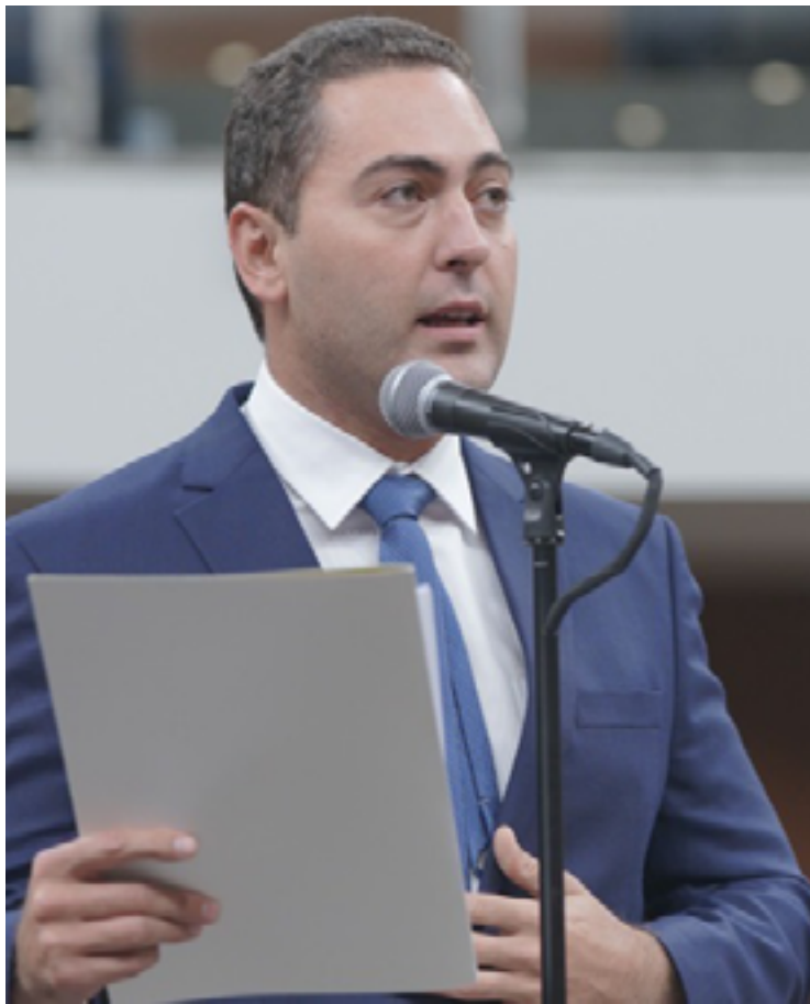
Assessoria de Lucas do Vale: “Seguimos um caminho que corrige alguns pontos que ocasionaram o veto ao projeto de Karlos”

Uma matéria semelhante havia sido aprovada em 2020, na Assembleia Legislativa de Goiás (Alego), em segunda votação, pelo placar de 22 votos a zero. No caso, o projeto de lei nº 1192/19, de autoria do deputado estadual Karlos Cabral (PSB), propõe a criação do programa “Nascer da Cidadania”, para tornar obrigatória a coleta de dados biográficos e biomé-