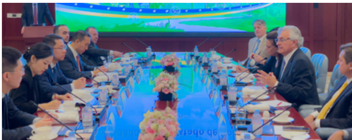
Comitiva goiana participou de várias atividades e reuniões no continente asiático: Goiás terá investimento chinês

abastecer a América Latina”, afirmou o governador.