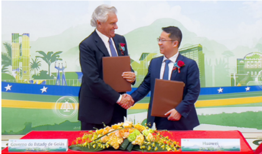
Governador Ronaldo Caiado trouxe acordos de cooperação e expectativa de investimento de seis indústrias

Também avançaram as negociações com os grupos CMOC, indústria de mineração e beneficiamento de nióbio e fosfato, que projeta investir R$ 3 bilhões em Goiás, e com a Weichai Group, topo do ranking em produção de motores elétricos, outra com interesse no município de Itumbiara. “Tivemos a oportunidade de avançar na negociação. Elevaremos o patamar tecnológico de Goiás, que será referência na produção de produtos de ponta em nosso estado, com a possibilidade de