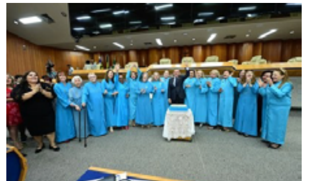
Evento reuniu intelectuais goianos na Câmara Municipal