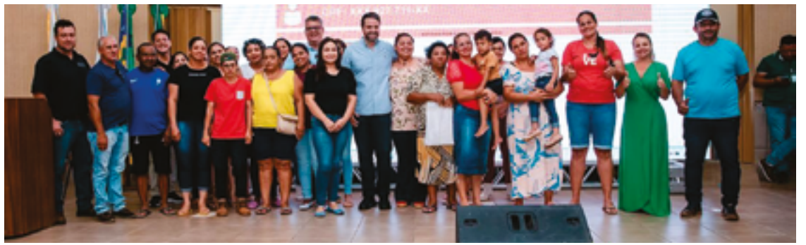
Contemplados com a casas a custo zero em Chapadão do Céu, após sorteio realizado na última segunda-feira, 14/11