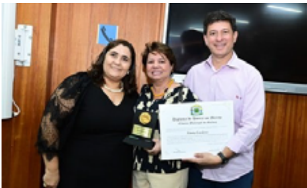
Agraciados na noite que celebra 54 anos da Aflag