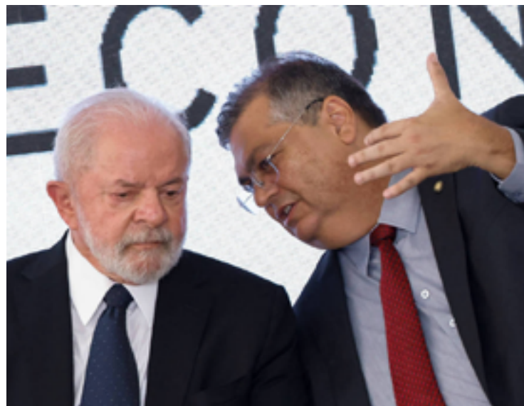
Lula da Silva e Flávio Dino: sem envolvimento com membros do narcotráfico