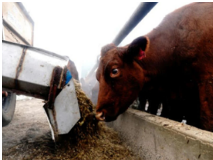
Após um 2023 marcado por desafios em função do ciclo positivo para o boi gordo, cabe ao pecuarista se planejar e tomar as melhores decisões

“Os produtores que não conseguem se manterem competitivos e com os fluxos