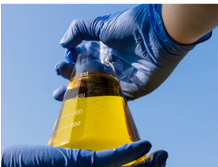
Milho, soja e canola também fornecem biomassa para o etanol e outros combustíveis verdes

No Brasil, esse é um potencial subaproveitado já que apenas 17% da capacidade instalada no setor sucroenergético está em operação. Para efeitos comparativos, no setor petrolífero, o índice de aproveitamento é quase pleno (97%). “Temos cerca de 60 indústrias que podem produzir 14,6 bilhões de litros de etanol por ano. Mas nossa estimativa é que, até o final de 2023, conseguimos