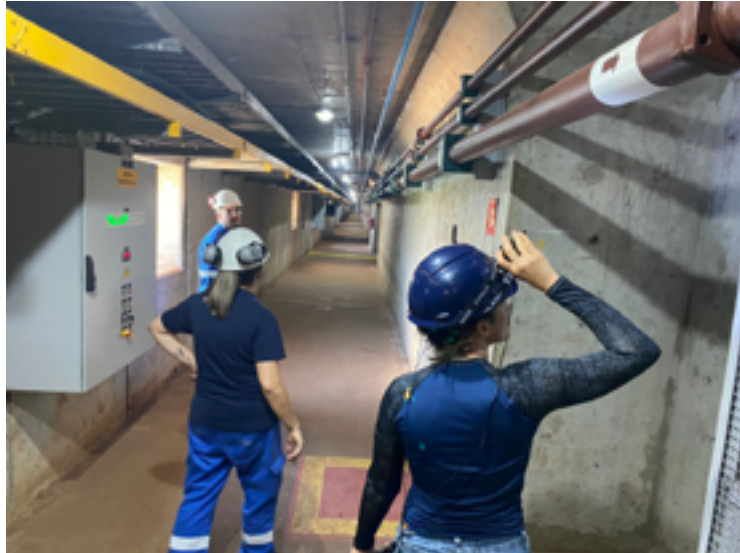
Fiscais da Agrodefesa GO em São Simão

Equipe de fiscais agropecuários da Agência Goiana de Defesa Agropecuária (Agrodefesa) esteve, na segunda-feira (13/11), visitando a unidade da Hidrelétrica Spic Brasil, em São Simão. A unidade é parceira da Agência, que realiza revisão constante das galerias e estruturas da usina que não estão em utilização para o monitoramento da presença de morcegos hematófagos, possíveis transmissores da raiva de