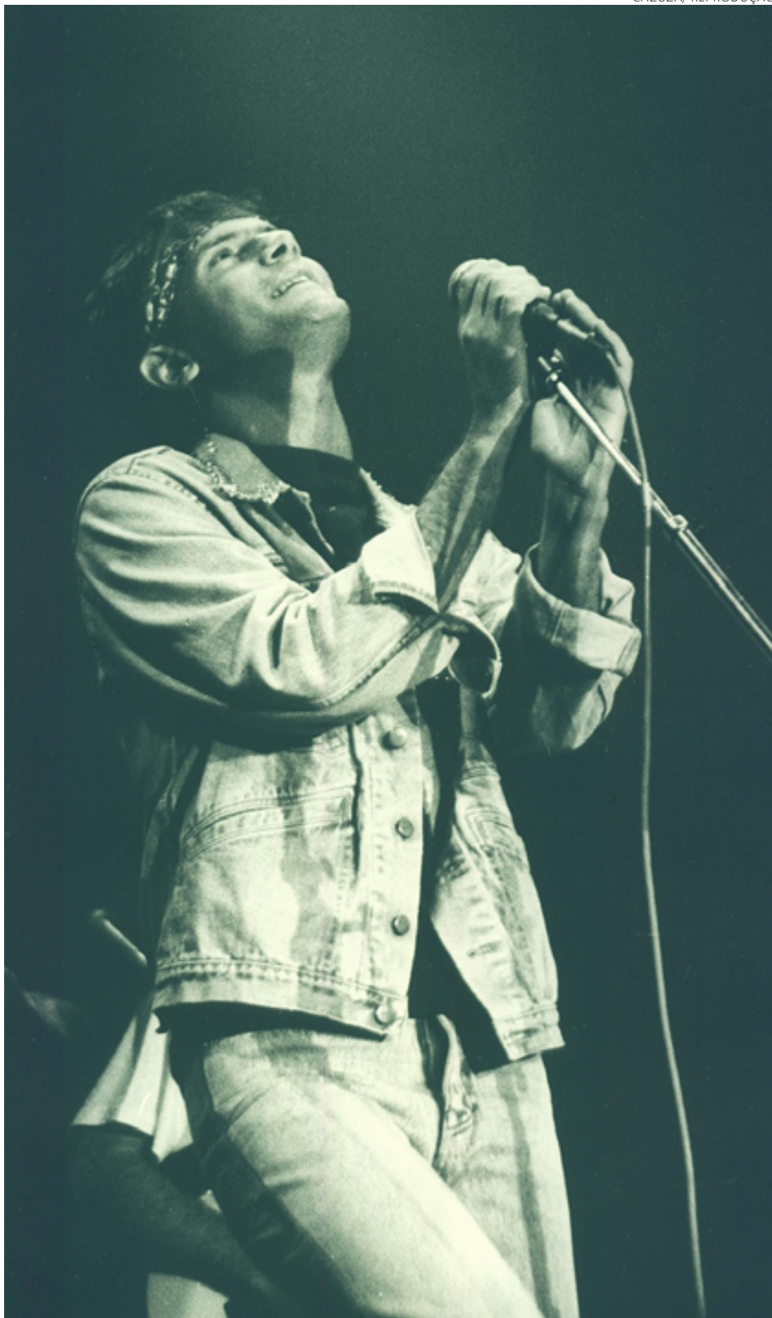
O tempo não para: Cazuza se apresenta em show para divulgar disco “Só Se For a Dois”, de 1987

Como se vê, muita música excelente foi feita pela dupla. As letras ressignificaram a fofa, tema tradicional na música